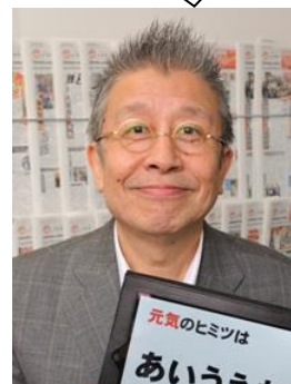
日本一明るい経済新聞 竹原編集長